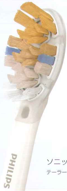
ソニックアー テラーメイド型電動歯ブラシ

ブラシヘッドが消耗すると歯垢除去力が落ちてしまいます。 歯垢除去力を維持するために3ヶ月に1回交換することをおすすめします。