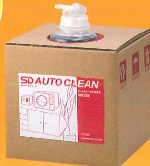
オートクリーン 5L オートクレーブ専用液