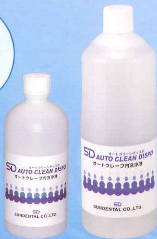
500mL 1,200mL 〈SDオートクリーン ディスポ〉