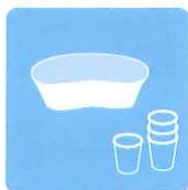
往診時の ツール類の除菌に