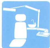
ユニットまわりの除菌に