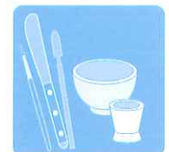
スパチュラや ツール類の除菌に