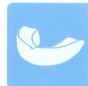
マウスガードや ホワイトニングトレイの除菌に