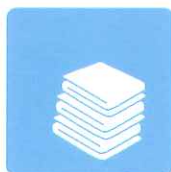
タオルや布類の 除菌・消臭に