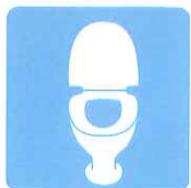
トイレの除菌・消臭に