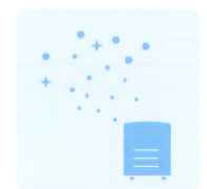
次亜塩素酸水対応 噴霧器で室内の除菌に