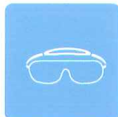
保護メガネの除菌に