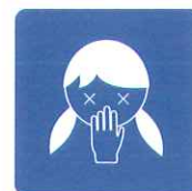
吐瀉物処理時の除菌に