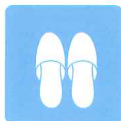
スリッパの除菌・消臭に