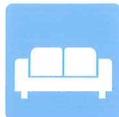
待合室のソファや テーブルの除菌に