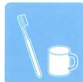
歯ブラシやTBI時の ツールの除菌に