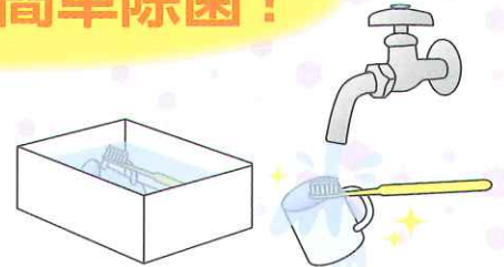
浸漬後 ▶ 水洗