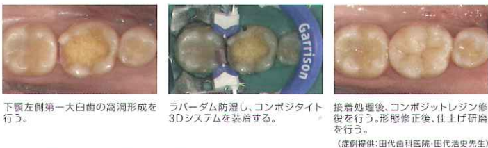
下顎左側第一大臼歯の高洞形成を行う。 ラバーダム防湿し、コンポジット3Dシステムを装着する。 接着処理後、コンポジットレジン修復を行う。形態修正後、仕上げ研磨を行う。 (症例提供:田代歯科医院・田代浩史先生)