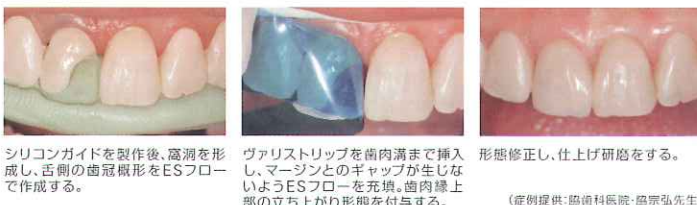
シリコンガイドを製作後、高洞を形成し、舌側の歯冠楔形をESフローで作成する。 ヴァリストリップを歯肉溝まで挿入し、マージンとのギャップが生じないようにESフローを充填。歯肉線上部の立ち上がり形態を付与する。 形態修正し、仕上げ研磨をする。 (症例提供:協歯科医院・藤宗弘先生)

販売名:コンポジット3D リテーナー 一般的名称:歯科用マトリックスリテーナー クラス分類:一般医療機器(クラスⅠ) 医療機器届出番号:27B1X00109000233 販売名:コンポジット3D システム 一般的名称:歯科用充填・修復材補助器具 クラス分類:一般医療機器(クラスⅠ) 医療機器届出番号:27B1X00109000236 販売名:コンポジット3D リングフォーセップス 一般的名称:歯科用充填・修復材補助器具 クラス分類:一般医療機器(クラスⅠ) 医療機器届出番号:27B1X00109000234 販売名:フュージョンバンド 一般的名称:歯科用マトリックスバンド クラス分類:一般医療機器(クラスⅠ) 医療機器届出番号:27B1X00109000330 販売名:フュージョンウエッジ 一般的名称:歯科用マトリックスウエッジ クラス分類:一般医療機器(クラスⅠ) 医療機器届出番号:27B1X00109000323 販売名:ヴァリストリップ 一般的名称:歯科用マトリックスバンド クラス分類:一般医療機器(クラスⅠ) 医療機器届出番号:27B1X00109000282