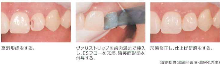
高洞形成をする。 ヴァリストリップを歯肉溝まで挿入し、ESフローを充填。隣接面形態を付与する。 形態修正し、仕上げ研磨をする。 (症例提供:協歯科医院・藤宗弘先生)