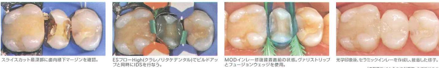
スライスカット最深部に歯肉線下マージンを確認。 ESフローHigh(クラレノリタケデンタル)でビルドアップと同時にIDSを行なう。 MODインレー修復接着直前の状態。ヴァリストリップとフュージョンウエッジを使用。 光学印象後、セラミックインレーを作成し、接着した様子。 (症例提供:きたみち歯科医院・北道敏行先生)