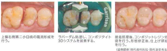
上顎右側第二小臼歯の高洞形成を行う。 ラバーダム防湿し、コンポジット3Dシステムを装着する。 接着処理後、コンポジットレジン修復を行う。形態修正後、仕上げ研磨を行う。 (症例提供:田代歯科医院・田代浩史先生)