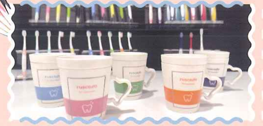
※実物と写真は色が異なる場合がございます。