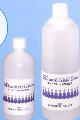
500mL 1,200mL (SDオートクリーン ディスポ)