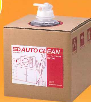
オートクリーン 5L オートクレーブ専用液