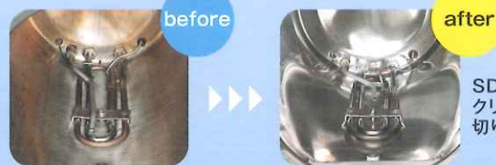
SDオート クリーンに 切り替え30日後