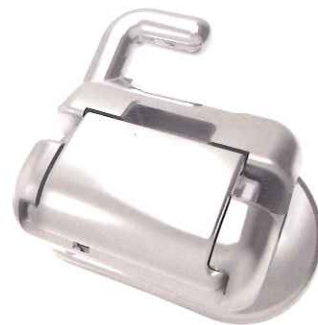
レベリング段階でもワイヤーを装着しやすい シャッターで開閉できる6番用チューブ